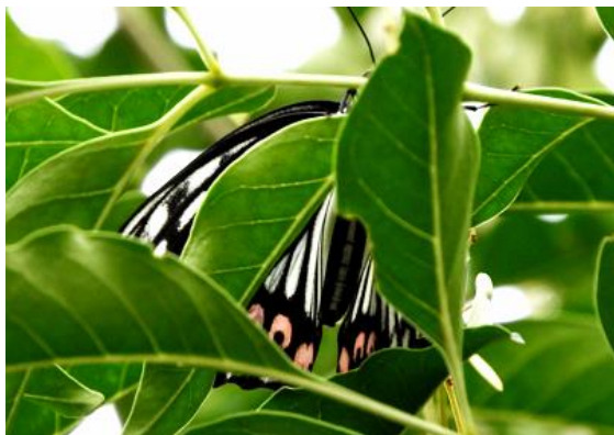
アカボシゴマダラ