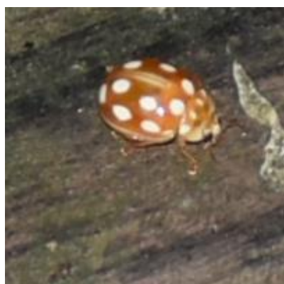
ムーアシロホシテントウ