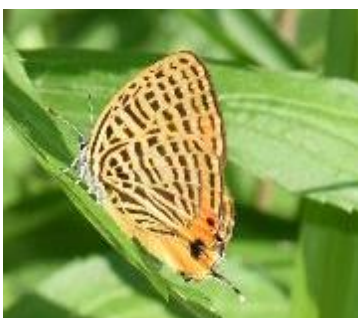
ウラナミアカシジミ