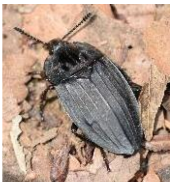
オオヒラタシデムシ