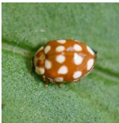
シロジュウシホシテントウ