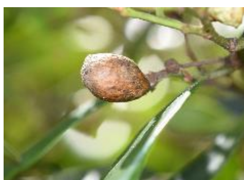
イスノキの虫えい（下見で確認）