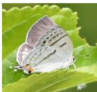
ミズイロオナガシジミ