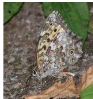
サトキマダラヒカゲ