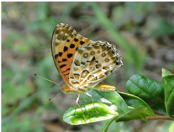
ツマグロヒョウモン♂