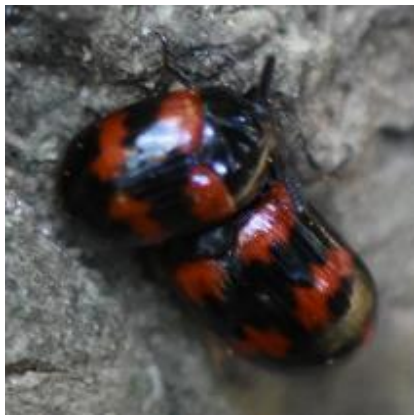
カタモンオオキノコムシ