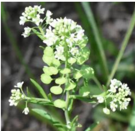
マメグンバイナズナ