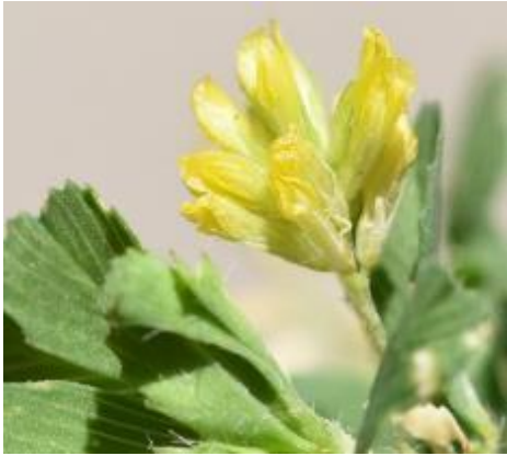
コメツブツメクサ