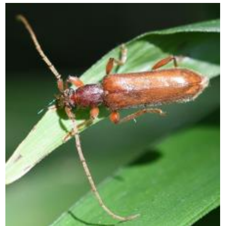
テツイロヒメカミキリ