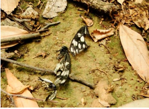
ゴマダラチョウの翅