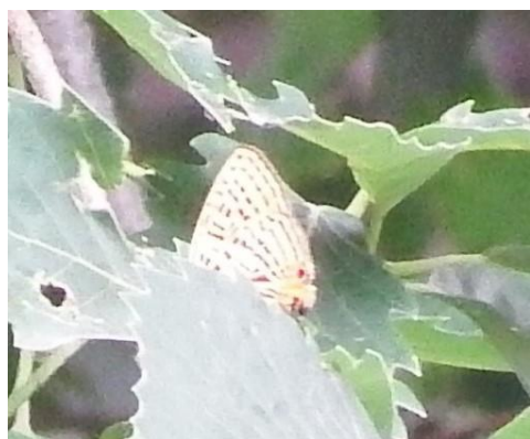
ウラナミアカシジミ