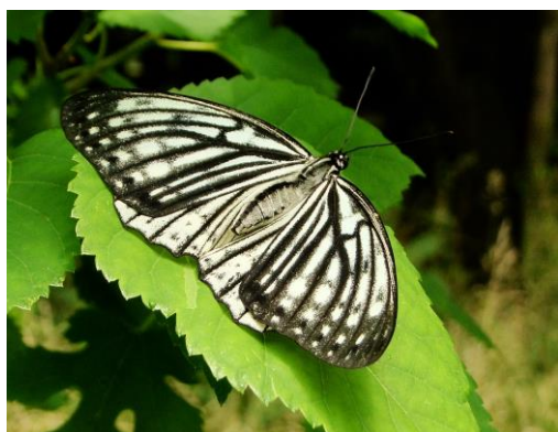
アカボシゴマダラ