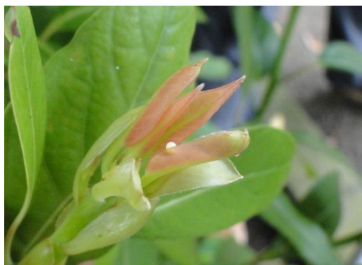
アオスジアゲハ卵