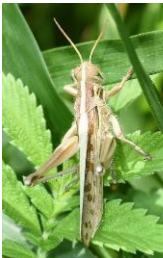
複眼の下に黒いすじがあるツチイナゴ ツチイナゴの幼虫は緑色