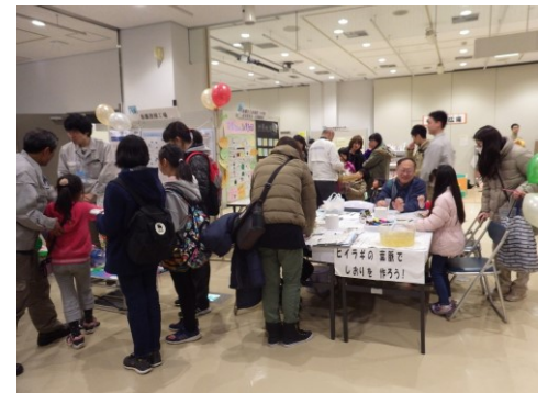
<体験コーナー(ワークショップ)イメージ>