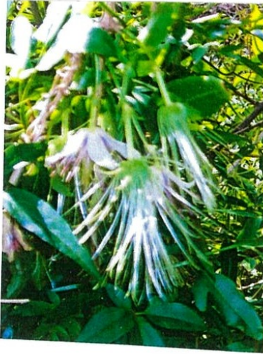
珍しい花が咲いていました。 クレマチス・ナパウレンシス ネパール原産です。