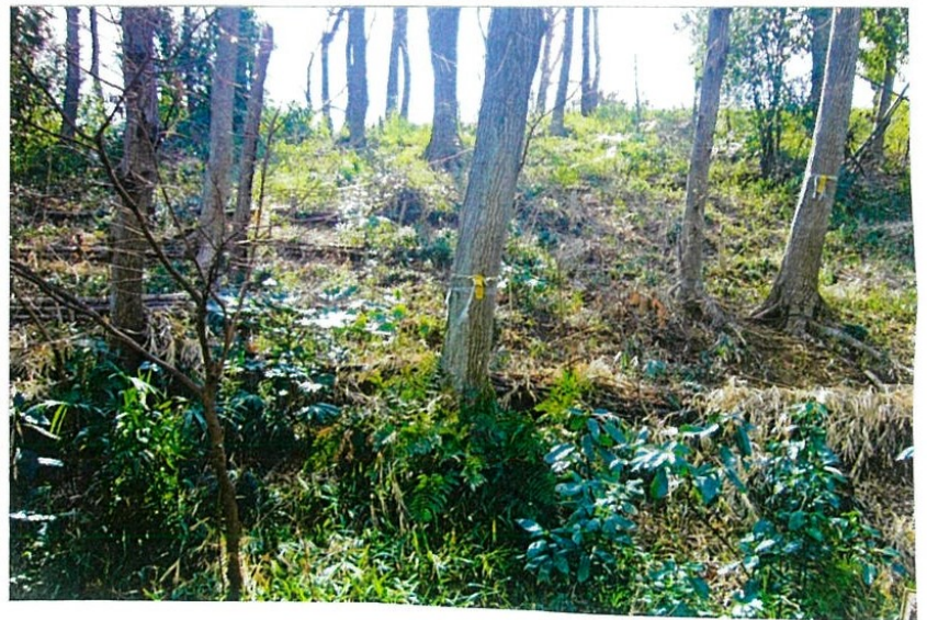
武蔵野の林の手入れのしかたなど学びました。