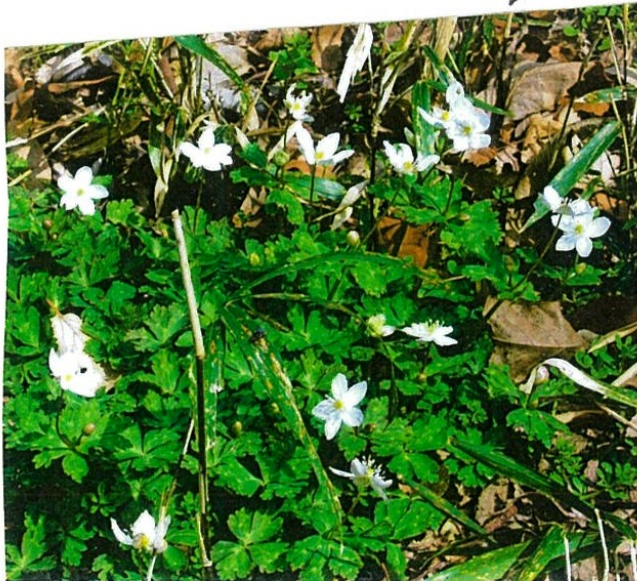
ニリンソウがもう 咲いていました。