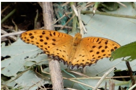
ツマグロヒョウモン♂