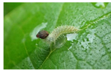
アカボシゴマダラ (幼虫)