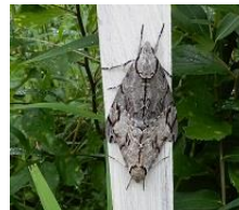
シモフリスズメ (交尾)