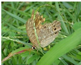
サトキマダラヒカゲ