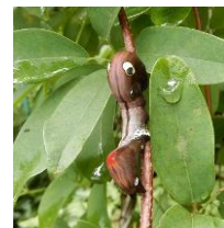
アケビコノハ (幼虫)