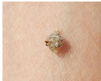
ニセコガタクサカゲロウの幼虫?