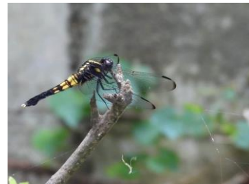
オオシオカラトンボ♀