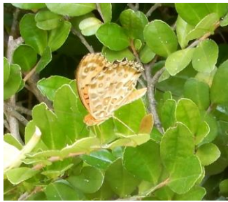
ツマグロヒョウモン♂