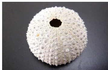
②つぶつぶがいっぱい