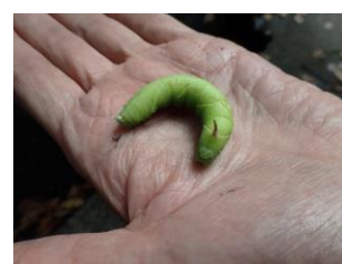
ウンモンズズメ (幼虫)