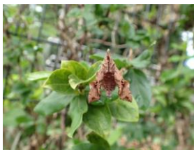
ホシヒメホウジャク