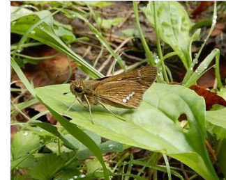
イチモンジセセリ