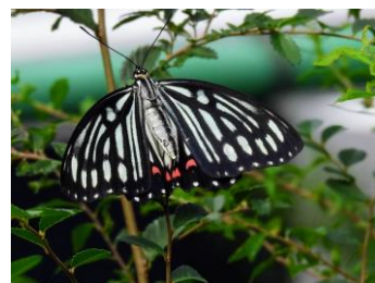
アカボシゴマダラ