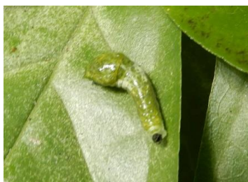
カラスアゲハ (幼虫)