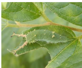
アカボシゴマダラ (幼虫)