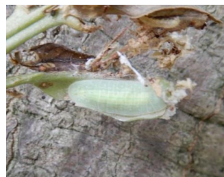
ムラサキツバメ (幼虫)