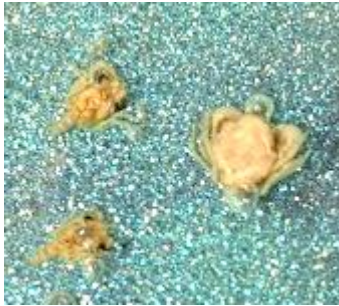
(① カニ )

このチリメンモンスターは、何かの生き物の赤ちゃんだよ。何の生き物だろう？口の中から選んで、( )に書いてみよう！