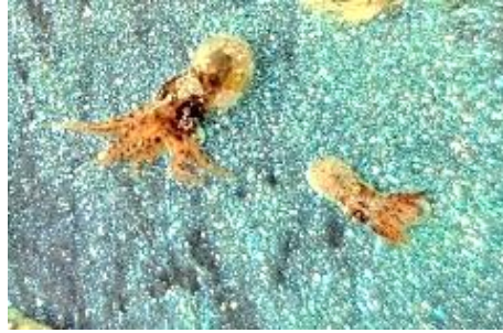
(② タコ )