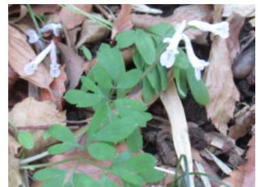
ジロボウエンゴサク

赤塚ため池公園で花合わせを行い、見られた開花植物はニリンソウの他にもナデシコ科の「コハコベ」「ミドリハコベ」「ウシハコベ」の3種。また上記写真の「ヒメカンスゲ」「ジロボウエンゴサク」がひっそりと開花しており、大門地区と同様に葉の展葉、つぼみを含み17種となりました。