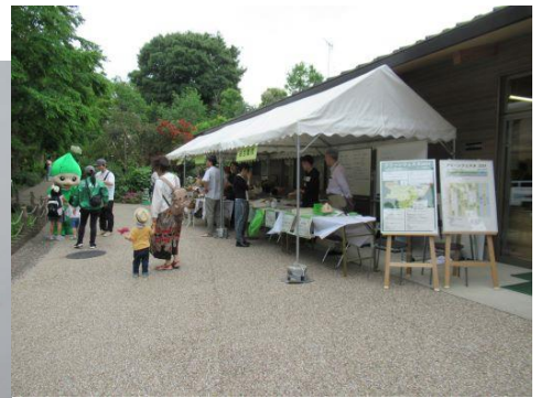
入り口付近の様子 りんりんちゃんも