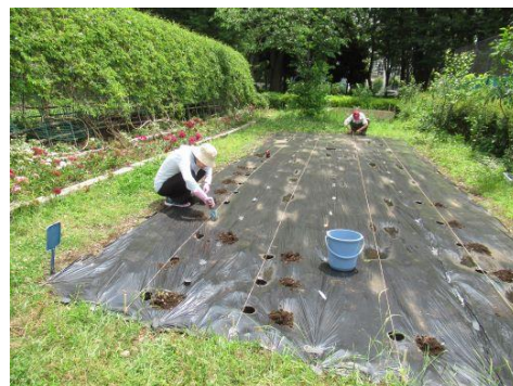
園児がすぐに植えることができるように穴をあけています