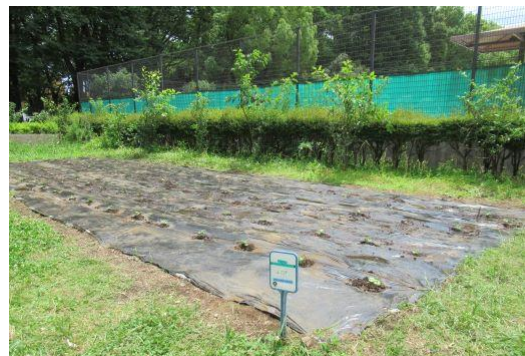
5月30日 苗植え完了 80苗