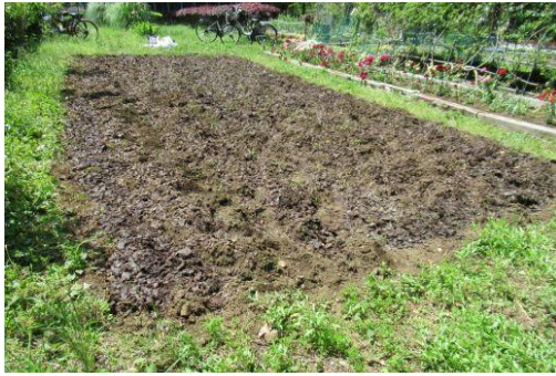
みんなで作った腐葉土をまきました