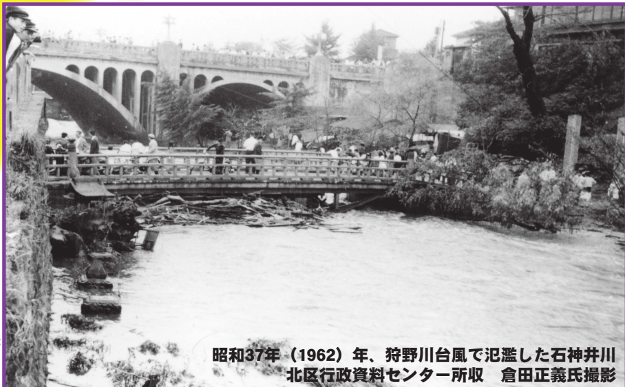
昭和37年（1962）年、狩野川台風で氾濫した石神井川

川岸の緑道にはソメイヨシノが植栽されましたが、その寿命は数十年。江戸時代から百年以上も続いてきた景色も現代ではすぐに消えてしまう「開発」＝「破壊」の時代になってしまいました。