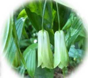
ホウチャクソウ 落ちても なお美しい…