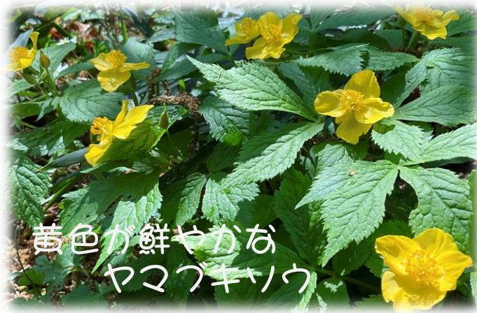
黄色が鮮やかな ヤマブキソウ

大門、そして城址地区では、4月にヤマブキソウが咲き始めるとニリンソウの白い世界から黄色へと変化していきます。もう少し見ていたいけれど、季節は先へ先へと移り変わっていきますね。