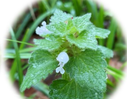
シロバナヒメオドリコソウ