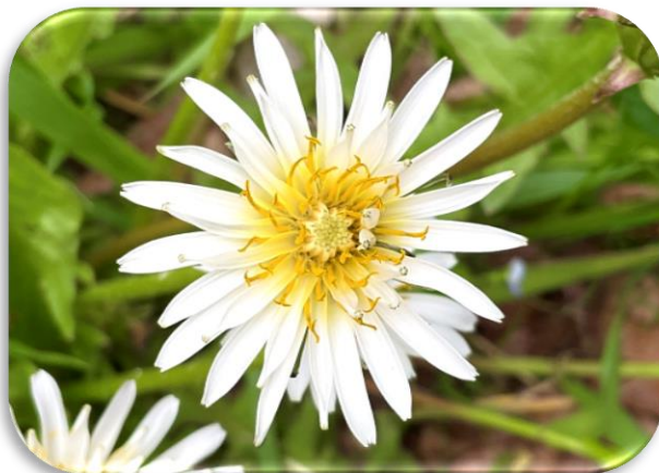
花びらの先をよく見て～♪

～あとがき～ 「花びらの先をよく見て～♪」これはシロバナタンポポです(^^) / よーく見ると花びらの先端が割れています！実は一つ一つが花だった名残りだとか♪ぜひ観察してみてくださいね！（写真・文/自然観察指導員わしみなおこ）